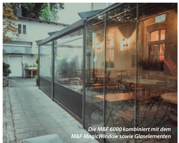
Die M&F 6000 kombiniert mit dem M&F MagicWindow sowie Glaselementen