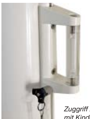
Zuggriff Acryl mit Kindersicherung